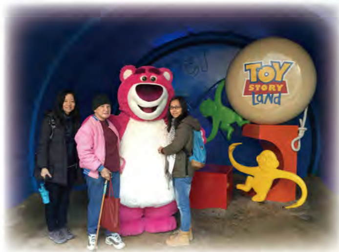
野生捕獲勞蘇，不得不合照呢！

本服務於2016年1月下旬舉辦了迪士尼奇幻之旅，當中有末期癌症的病人及獨居長者參加，雖然當日天氣不穩定，但也不減大家的遊玩心情，盡顯童真！