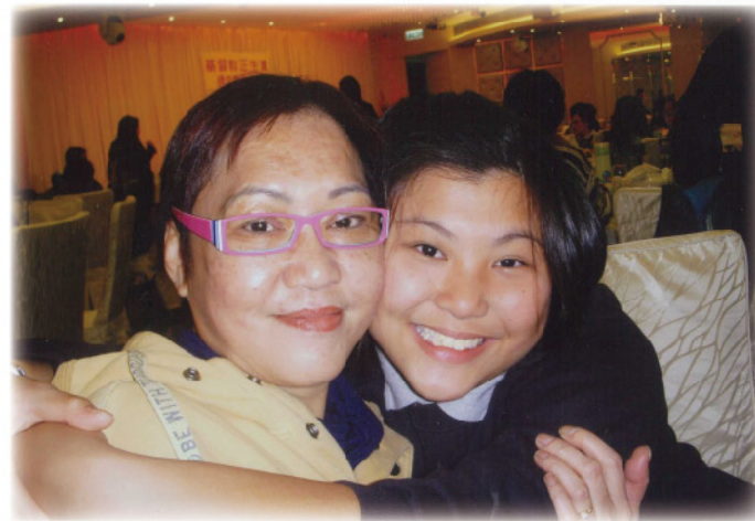
▲ 冰姐與囡囡的合照

阿冰現時花很多時間做義工服務，因為她希望協助有需要的人及多關心別人；亦希望自己可以在有限的生命上做一些有意義的工作。